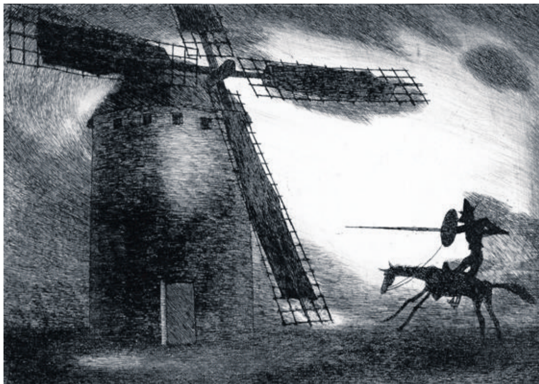
«Don Quichotte se lance à l'assaut des moulins», extrait du livre.

Durant près de septante ans, ces plaques de cuivre, qui n'avaient jamais servi, sommeillaient dans les ateliers Rigal près de Paris. «Prévenu par la fille d'Alexeïeff, c'est là que je les ai découvertes il y a douze ans. Malgré leur mauvais état, je me suis rendu compte qu'il s'agissait d'un des chefs-d'œuvre de mon ami, qui